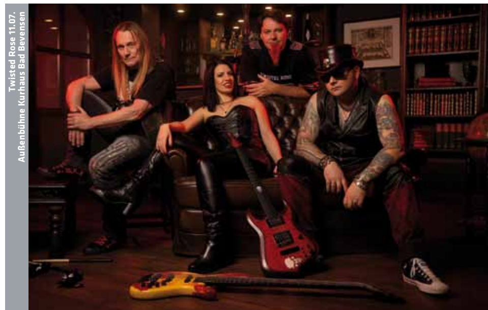
Twisted Rose 11.07. Außenbühne Kurhaus Bad Bevensen