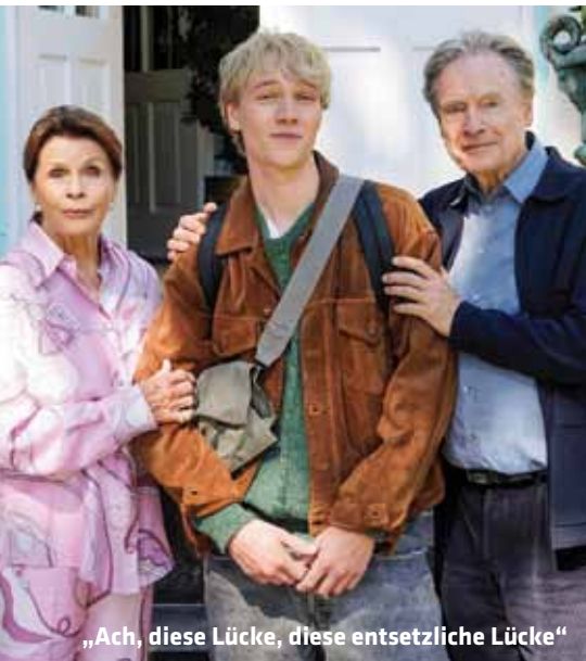
„Ach, diese Lücke, diese entsetzliche Lücke“