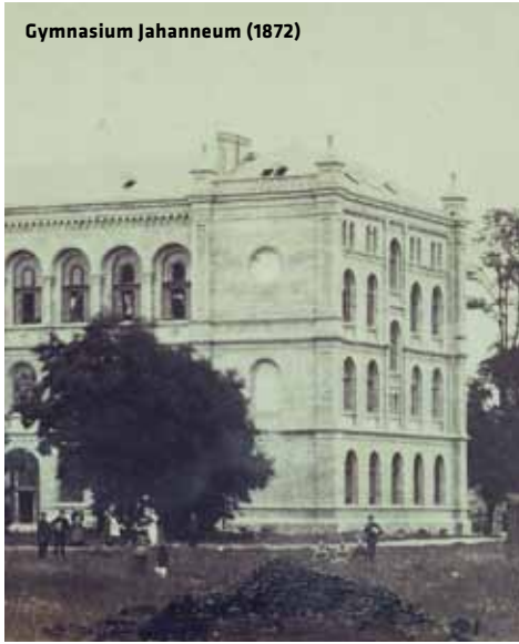
Gymnasium Jhanneum (1872)

AUßERGEWÖHNLICH Noch bis zum 16. August präsentiert das Gymnasium Johanneum im Museum Lüneburg die Sonderausstellung „Die ersten Fußballer Deutschlands? Eine Lüneburger Schul- und Sportgeschichte“. Am 28. August 1875 trafen sich Schüler des Johanneums, um nach den Regeln der englischen Football Association zu spielen. Der erhaltene Bericht über dieses Spiel gilt als die früheste bekannte Quelle eines einzelnen Fußballspiels auf deutschem Boden. Zugleich nennt er mit den Lüneburger Schülern die ersten namentlich bekannten Fußballspieler Deutschlands.