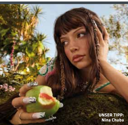
UNSER TIPP: Nina Chuba