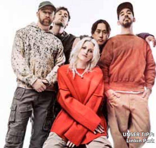
UNSER TIPP: Linkin Park