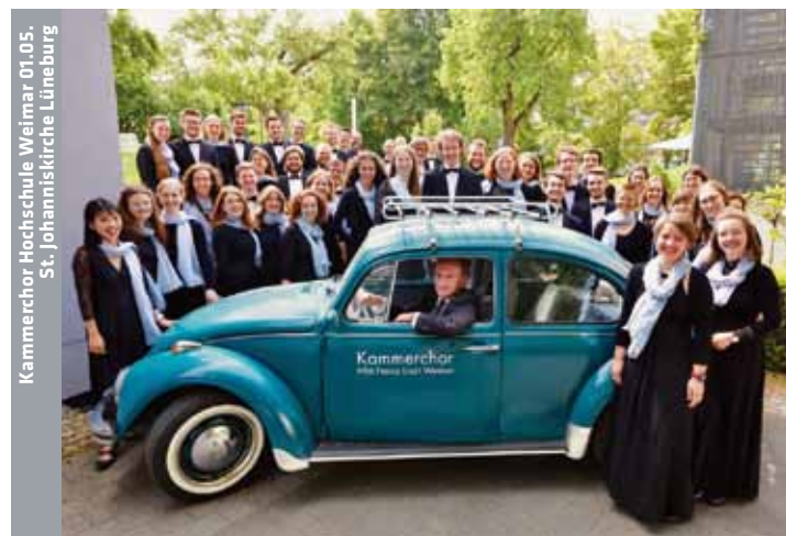
Kammerchor Hochschule Weimar, 01.05., St. Johanniskirche Lüneburg

LG 17:30 Museum Lüneburg , Öffentliches Schaudrucken – Drucken an der Spindelpresse, Aktion des Arbeitskreises Erlebnisdruckerei, ohne Anmeldung