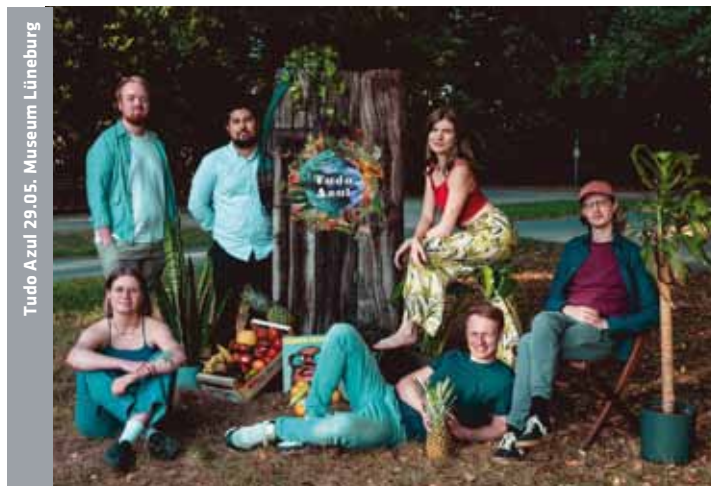
Tudo Azul 29.05. Museum Lüneburg

LG 20:00 TamTam am Markt , „Aus den Scherben der Zeit“, Gastspiel