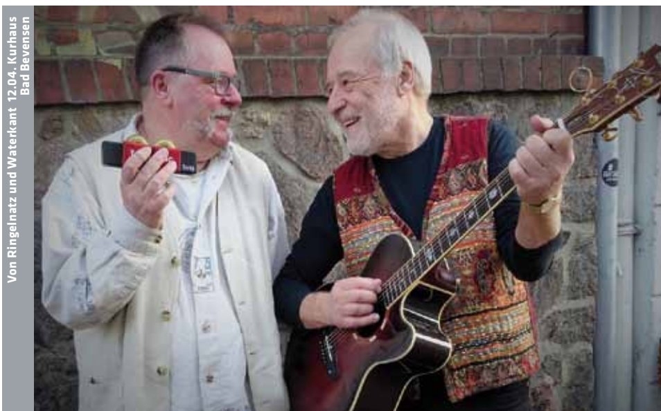
Von Ringelnatz und Waterkant 12.04., Kurhaus Bad Bevensen

LG 18:00 Theater Lüneburg , „Ein Volksfeind“, Schauspiel