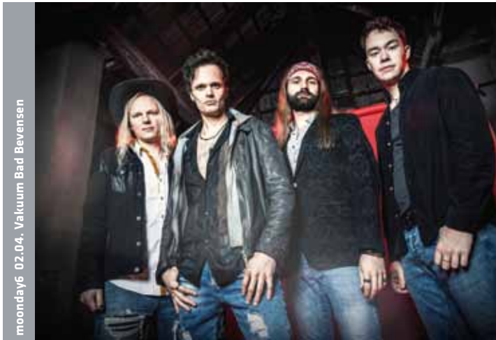
moonday6 02.04. Vakuum Bad Bevensen