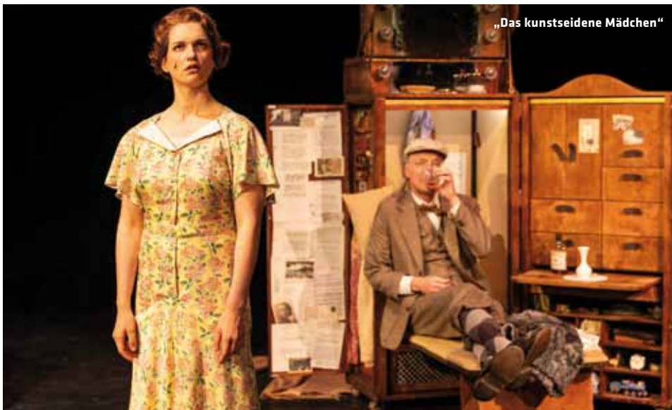
„Das kunstseidene Mädchen“

CHANSON-MUSICAL MIT DEM THEATER FÜR NIEDERSACHSEN