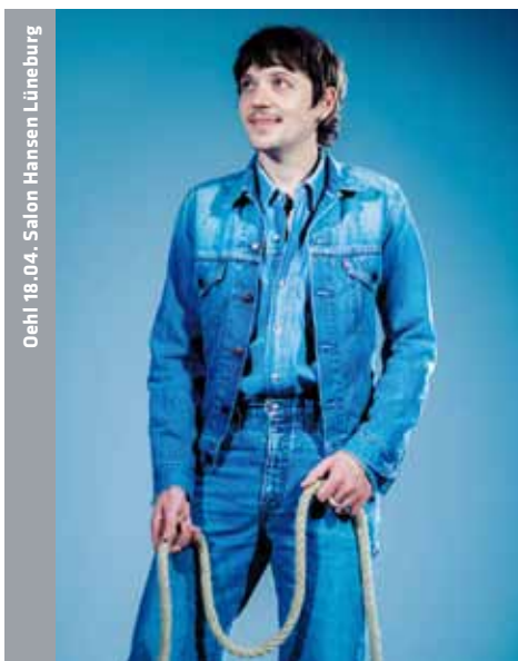
Oehl 18.04. Salon Hansen Lüneburg

LG 19:30 Theater im e.novum, „Das Fest“, mit dem Erwachsenenensemble 13