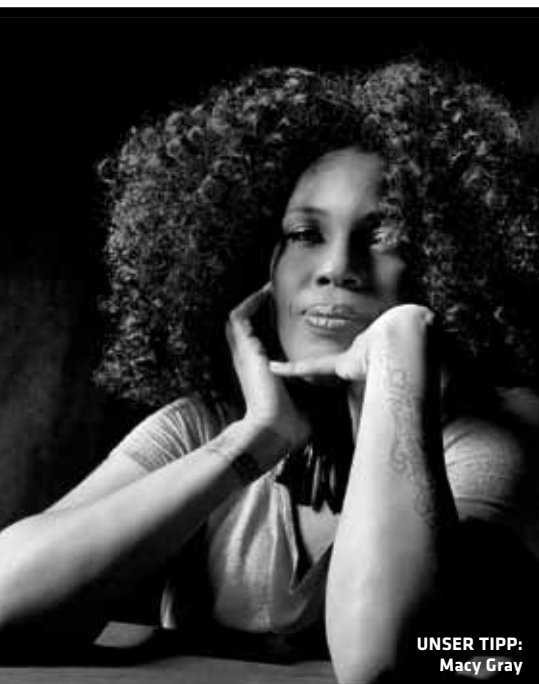
UNSER TIPP: Macy Gray