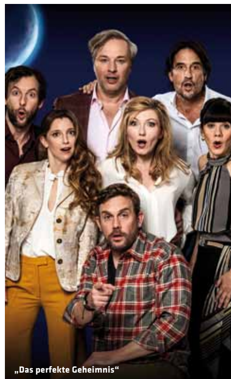
„Das perfekte Geheimnis“