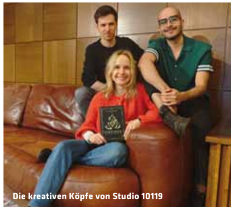
Die kreativen Köpfe von Studio 10119