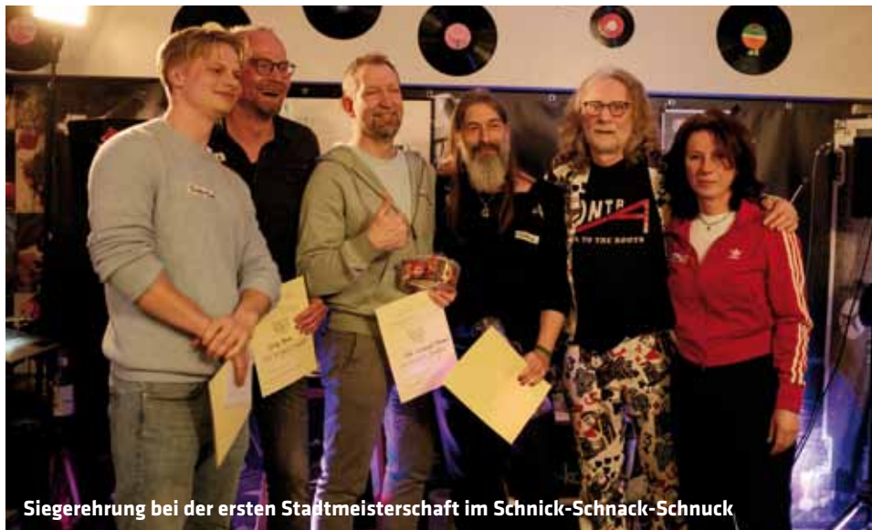
Siegerehrung bei der ersten Stadtmeisterschaft im Schnick-Schnack-Schnuck

2. LÜNEBURGER STADTMEISTERSCHAFT IM SCHNICK-SCHNACK-SCHNUCK