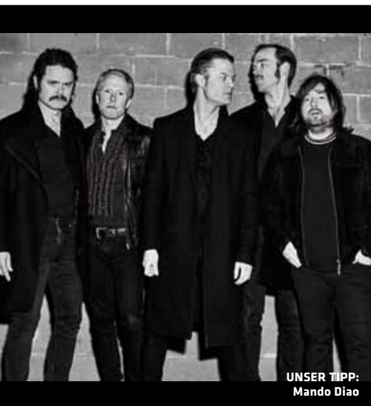
UNSER TIPP: Mando Diao