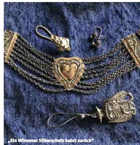
„Ein Winsener Silberschatz kehrt zurück“

Was trug man im 19. Jahrhundert hier in der Gegend? Wie sahen damals Eheringe aus? Wann wurde der Schmuck angelegt und was war am beliebtesten? Einige der Schmuckstücke sind ganz charakteristisch für die Region um Winsen und zeigen die wirtschaftliche Stärke der Bevölkerung. So waren jahrhundertlang Goldschmiede, die natürlich auch mit Silber arbeiteten, in Winsen tätig. Um 1900 sammelte der Goldschmied Voje angekauften Schmuck beziehungsweise den beim Kauf neuer Stücke eingetauschten alten Schmuck und erhielt so einen wahren Schatz an Schmuckstücken. Viele dieser Stücke wurden aufbewahrt und wanderten schließlich in Sammlungen bedeutender Museen im In- und Ausland. Es bedurfte kriminalistischer Arbeit, um herauszufinden, wo die umfangreichen Sammlungen verblieben waren. Umso erfreulicher ist es, dass das Museum im Marstall nun einen ansehnlichen Teil dieser Sammlungen nach Winsen zurückholen konnte. Begleitend findet am Wochenende 25./26. November ein kleiner Kunsthandwerkermarkt mit Schwerpunkt Schmuck im Marstall statt. (JVE)