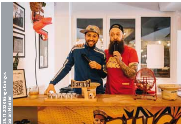
25.11.2023 Bingo Oringos Salon Hansen

UE 16:00 Klosterkirche Ebstorf, Posaunenchor der ev. Kirchengemeinde Ebstorf