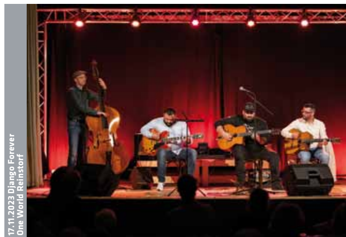
17.11.2023 Django Forever One World Reinstorf

LG 9:30 Innenstadt Lüneburg, Beginn des Weihnachtsmarktes, bis 30. Dezember