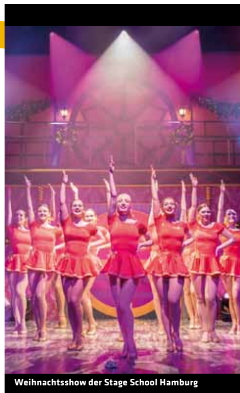
Weihnachtsshow der Stage School Hamburg